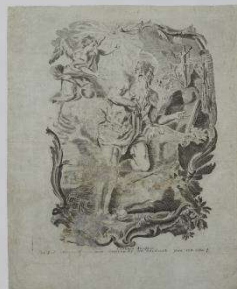
Гравюра «Святой Анофрий»