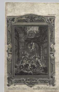
Гравюра «Врагов Даниила пожирают львы»