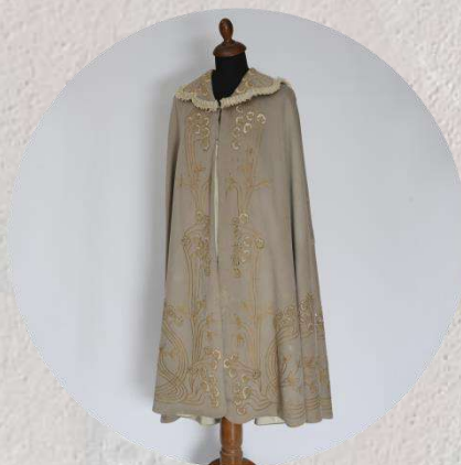
Ротонда, женская накидка. Вторая половина XIX - начало XX вв.