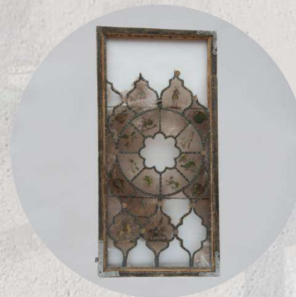
Оконница слюдяная. Россия. Конец XVII в.