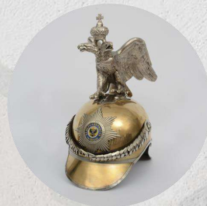
Каска нижних чинов Вторая половина XIX - начало XX вв.