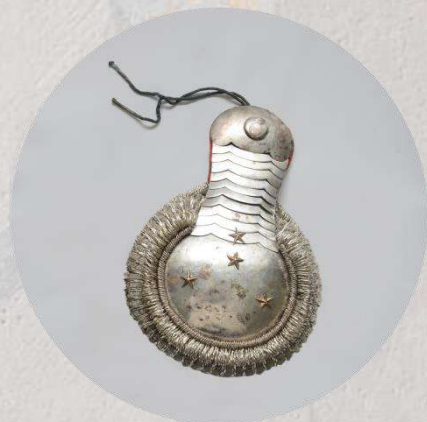
Эполет офицерский с чешуйчатой «шейкой». Российская империя. После 1827 г.