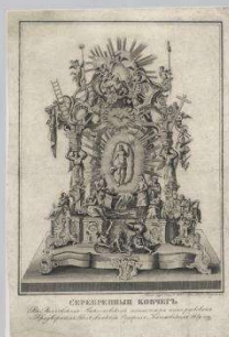
Гравюра «Серебряный ковчег»