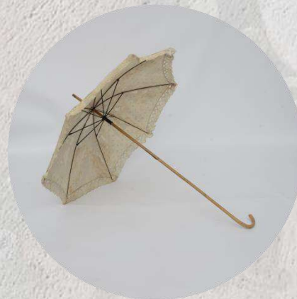
Зонт. Начало XX в.