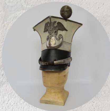
Шапка уланская, офицерская, штабс-ротмистра Сибирского полка. Россия. 1835 г.