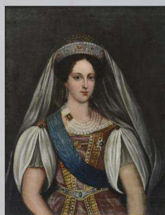
Картина «Портрет императрицы Марии Александровны». Неизвестный художник. XIX в.