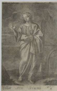
Гравюра «Святой Апостол евангелист Иоанн»