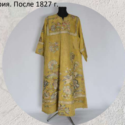
Стихарь. Вторая половина XVIII в.